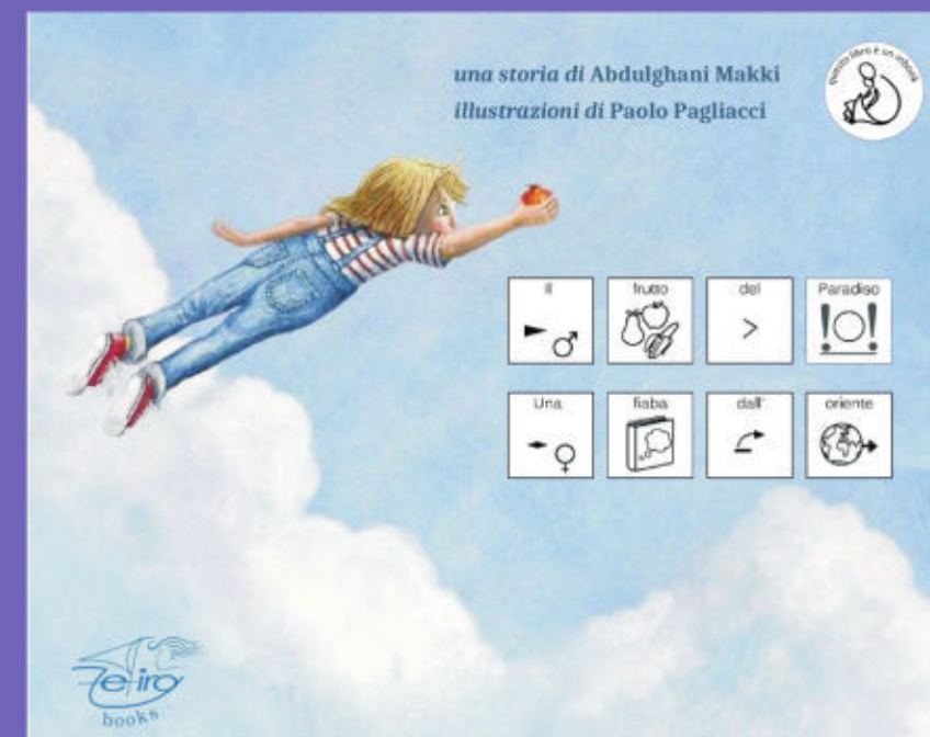
Il Frutto del Paradiso

La realizzazione dei laboratori sarà sia in presenza sia online, tenuto conto delle disposizioni dei decisori politici.