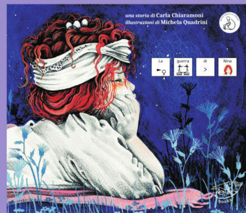
La guerra di Nina